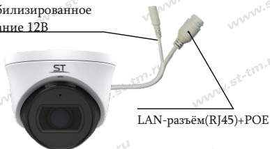
Рис. 1 Схема подключения видеокмеры